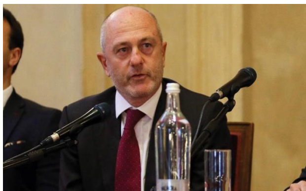
Angelo Binaghi - Presidente FITP

Una volta formalizzata l'adesione al Progetto, le attività verranno concordate direttamente con le single Istituzioni scolastiche al fine di ottimizzare i tempi di inizio, lo svolgimento, il completamento delle attività stesse ed il loro inserimento nel Piano Triennale dell'Offerta Formativa (P.T.O.F.) dell'Istituto .